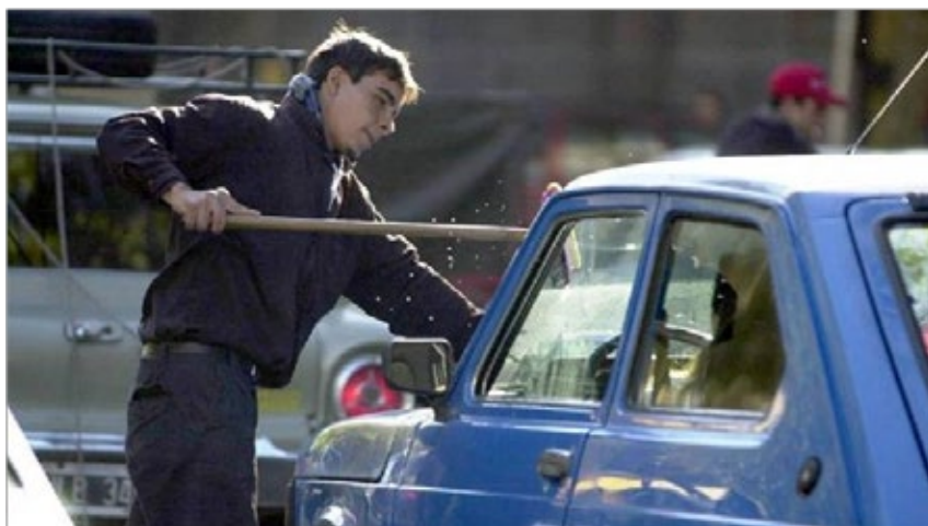
procesos extremos na constituição da cidade

7. INTERACCIÓN SOCIAL FUNDADA EN EL CONFLICTO Y LAS DESIGUALDADES (FUENTE: DIARIO EL LITORAL SANTA FE DEL 19/08/2013. HTTP://WWW.DIARIOELLITORAL.COM . ACCESO: NOVIEMBRE 2013).