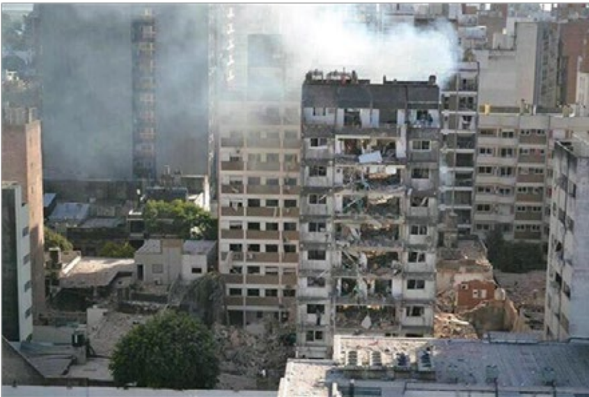
FIG. 8: EXPLOSIÓN DEBIDO A FUGA DE GAS. EL EJERCICIO DE LAS RESPONSABILIDADES SE VE RESQUEBRAJADO DEBIDO A RAZONES MÚLTIPLES QUE VAN DESDE LAS ESTRUCTURALES A LAS CIRCUNSTANCIALES. EN CUALQUIER CASO, EL AMBIENTE URBANO SE PERCIBE COMO POCO SEGURO Y CON PLANES DE CONTINGENCIA IMPRECISOS (FUENTE: HTTP://WWW.LANACION.COM.AR/1607985-EXPLOSION-EDIFICIO-ROSARIO . 06/08/2014. ACCESO: NOVIEMBRE 2013).

axiomáticas y fundantes de las relaciones interpersonales con las que se construye el vínculo social. Impone un orden – una estructura – que es previo al momento de la acción de los sujetos, quienes por lo tanto se sujetan o quedan