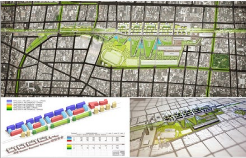
FIG. 4. ÁREAS FERROVIARIAS DESAFECTADAS EN EL BARRIO DE CABALLITO, EN BUENOS AIRES, QUE FUERON OBJETO DE UN CONCURSO PARA SU RECONVERSIÓN URBANA. PROCESOS SIMILARES SE VEN EN DISTINTAS CIUDADES ARGENTINAS, RELATIVOS A TERRENOS NO SÓLO FERROVIARIOS SINO TAMBIÉN INDUSTRIALES Y PORTUARIOS. CONCURSO NACIONAL PLAN MAESTRO PLAYA FERROVIARIA CABALLITO, PRIMER PREMIO: ARQUITECTOS EDGARDO BARONE Y GABRIELA LUCCHINI. FUENTE: GALDAMES, DANIELA. “PRIMER LUGAR CONCURSO NACIONAL PLAN MAESTRO PLAYA FERROVIARIA CABALLITO, ARGENTINA”, 26 FEB. 2014. PLATAFORMA ARQUITECTURA (FUENTE: HTTP://WWW.PLATAFORMAARQUITECTURA.CL/?P=339102 . ACCESO: ABRIL 2014).

simbólicas que aluden a separaciones, distanciamientos y quiebres tanto geográficos como sociales, económicos y culturales. En la ciudad escindida, los bordes y fronteras