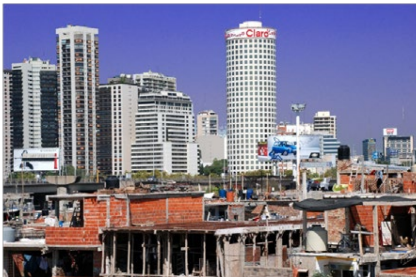
FIG. 3. CRECIMIENTO DESCONTROLADO DE LAS VILLAS.

atravesados por las tendencias privatistas, los hábitos consumistas y la mediocridad cultural estimulada por la reforzada presencia de los medios que brindan modelos que van a ser replicados ad infinitum en estos sectores urbanos medios.