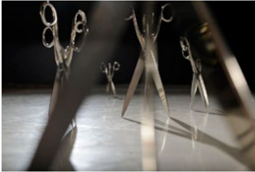
FIG. 8: SCHERENTÄNZERINNEN, VALIE EXPORT. (LUKAS BECK, 2008)

referencia visual que llamara a la memoria del sitio; únicamente la vía, que recorría el lugar casi sin tocarlo, sin deformarse al entrar en contacto con él. La línea ni siquiera atravesaba la puerta principal por la que entraban los trenes que transportaban a las víctimas, puesto que nadie, para los arquitectos, debía pasar por esa puerta de nuevo. Tampoco se reprodujo ninguna otra trayectoria reconocible, como la que los presos recorrían desde su