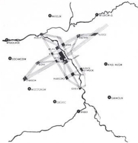
FIG. 4: ESQUEMA DEL PLAN WARSZAWA FUNKCIONALNA, DESARROLLADO POR J. CHMIELEWSKI Y S. SYRKUS EN 1933. (EDMUND GOLDZAMT, 1977)

(1993) hace un interesante análisis del fenómeno en términos lefebvrianos, partiendo de que “el poder de los movimientos de oposición reside en su capacidad para apropiarse del «espacio del otro » y transformarlo de forma que articule su propia visión política” (1993:395). Es la práctica