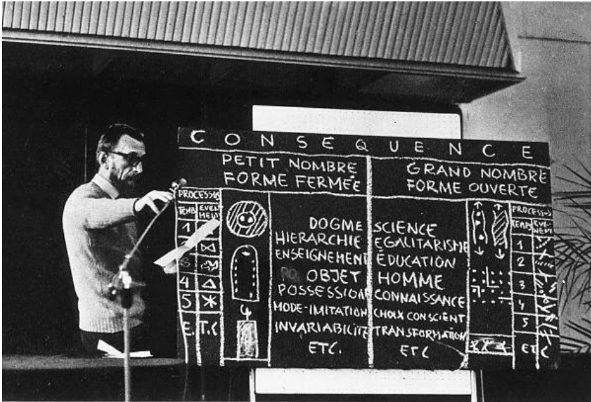
FIG. 6: OSKAR HANSEN EXPONIEDO LA TEORÍA DE LA FORMA ABIERTA (MUSEO DE ARTE MODERNO DE VARSOVIA, 2013)