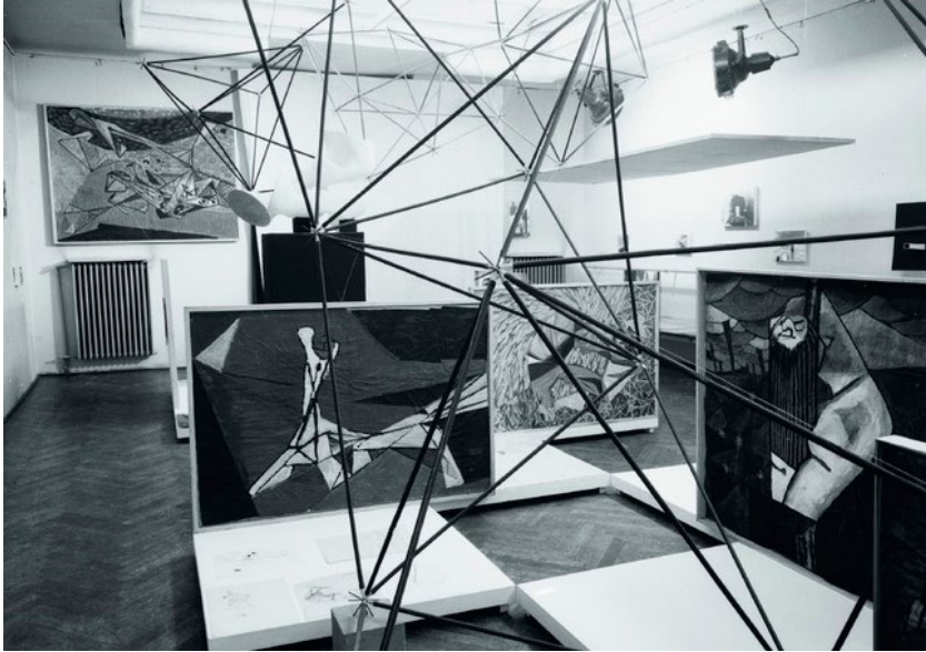
FIG. 5: EXPOSICIÓN INDIVIDUAL DE OSKAR HANSEN EN EL MUSEO JUDÍO DE VARSOVIA (ARCHIVO DE OSKAR HANSEN, VÍA GRAHAM FOUNDATION, 1977)

su función social en la capital: la escena nocturna posee una vitalidad desconocida en años, al menos en las zonas más céntricas. Tiananmen sigue siendo el centro geográfico y simbólico de la trama urbana; cada día miles de turistas la visitan, impresionados por las