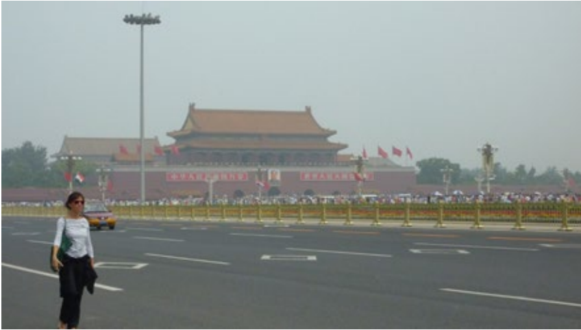
FIG. 2: PLAZA Y PUERTA DE TIANANMEN, PEKÍN (ANTONIO SILVA, 2011)

el reconocimiento del nosotros en el otro, como afirma Cacciari en su Archipiélago (1999). No es casualidad, por tanto, que desde aquí se busquen conclusiones y formas de actuar en tres ciudades en un principio lejanas a nuestro ámbito occidental más próximo – Pekín, Varsovia, Estambul – y desde temporalidades diferentes, ya que contemplando