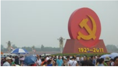
FIG. 3: IZQUIERDA: MONUMENTO AL PARTIDO COMUNISTA CHINO EN SU CENTENARIO, PLAZA DE TIANANMEN. DERECHA: SEDE DE LA CCTV, OMA. PEKÍN.