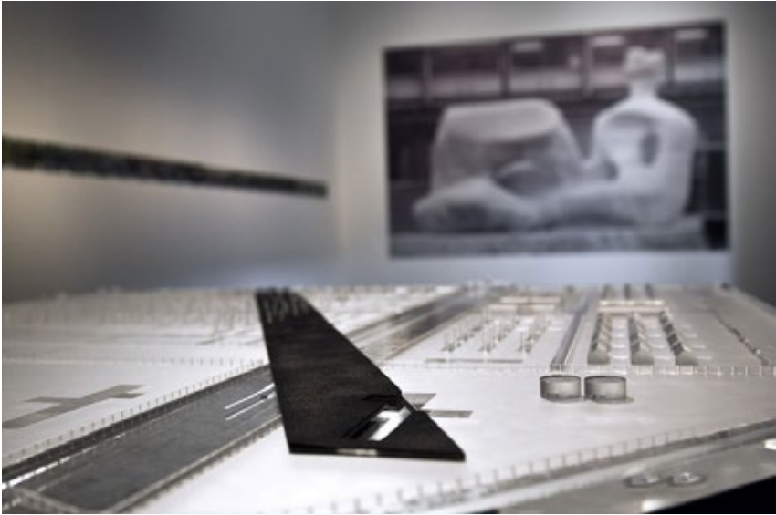
FIG. 7: MAQUETA DEL PROYECTO DEL EQUIPO DE OSKAR HANSEN PARA EL MEMORIAL DE AUSCHWITZ, EN LA EXPOSICIÓN “MOORE & AUSCHWITZ”, TATE BRITAIN, INGLATERRA. (MAGDALENA HUECKEL, 2010)

se disuelve en la complejidad de conexiones continentales por tierra, mar o aire. Tras los bombardeos nazis, que destruirían un 80% de la ciudad, el plan se vuelve aún más sugerente: la ciudad física realmente ha desaparecido y, ahora, todos los espacios son posibles.