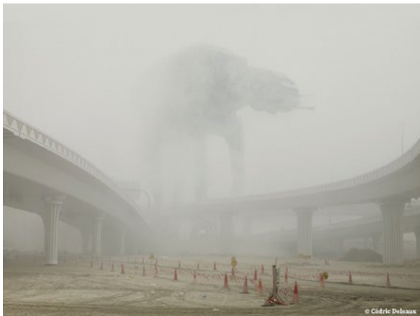
FIG. 1: AT-AT IN FOG, DUBAI. DARK LENS (CÉDRIC DELSAUX, 2009)