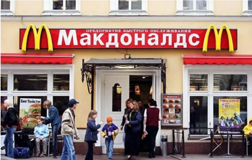
FIG. 1: MCDONALD'S DE MOSCÚ (RUSIA)