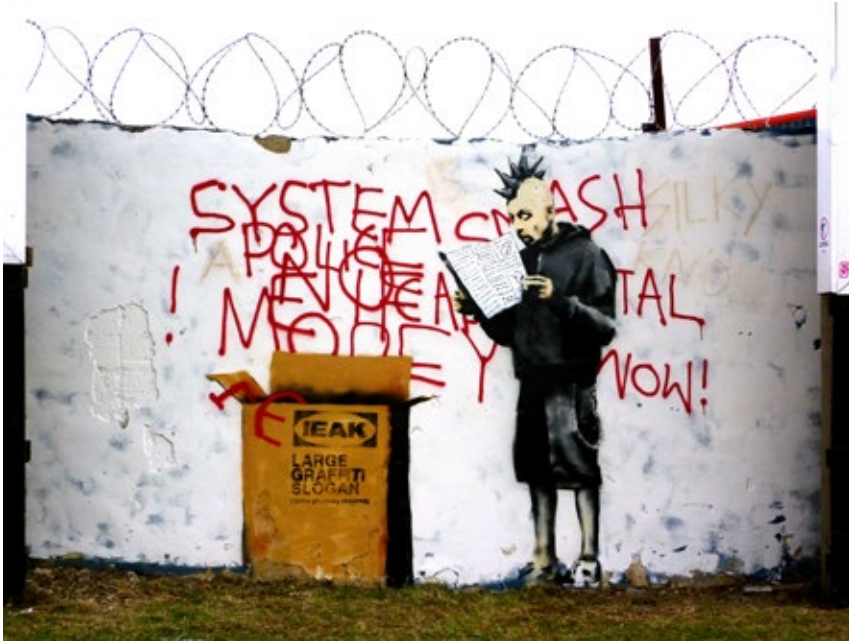
FIG. 7: GRAFFITI ATRIBUIDO A RALPH BANSKY, EN CROYDON, LONDRES.

siempre urgentes e ineludibles, susceptibles de movilizar la inquietud del conjunto completo de los ciudadanos, sin abrir nunca fisuras.