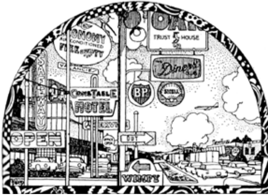
FIG 4. ARRIBA, UNA DE LAS IMÁGENES DE NON-PLAN, DE BANHAM, PRICE, HALL Y BAKER (BANHAM ET AL, 1969). ABAJO, POSTAL DE LAS VEGAS, QUE TANTO FASCINARON A SCOTT BROWN Y VENTURI CASI SIMULTÁNEAMENTE (AUNQUE LA FOTO ES DE 1985, RETIENE EL ESPÍRITU DE LAS FOTOS ORIGINALES DE VSBA). LOS INCREÍBLES PARECIDOS VISUALES HABLAN CLARAMENTE DE UN CIERTO ALINEAMIENTO IDEOLÓGICO, O CUANDO MENOS FORMAL, ENTRE ESTOS DOS EJES PRINCIPALES DEL PROCESO REVERSIVO QUE CONDUCE DE LA ARQUITECTURA CONTRACULTURAL DE LOS SESENTA AL NEOLIBERALISMO DE LOS OCHENTA.