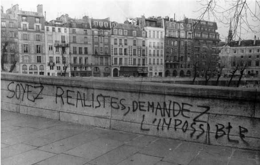
FIG. 3: “SEAN REALISTAS, PIDAN LO IMPOSIBLE”. EL EVOCADOR LEMA DE MAYO DEL 68, A LA LUZ DE LO EXPUESTO POR LOS AUTORES CITADOS EN ESTOS PÁRRAFOS BIEN PODRÍA LEERSE DESDE EL LADO DEL NUEVO MERCADO: “PIDAN (INVENTEN, DESEEN) LO IMPOSIBLE, PARA QUE PODAMOS HACERLO REAL... Y VENDERSE-LO”.

se desarrollan a lo largo de los sesenta para emerger al final de la década en una eclosión de movimientos simultáneos e interrelacionados. Basándose en los textos de Lefebvre, los situacionistas, Mumford, pero sobre todo en el grandísimo éxito de Jane Jacobs y su