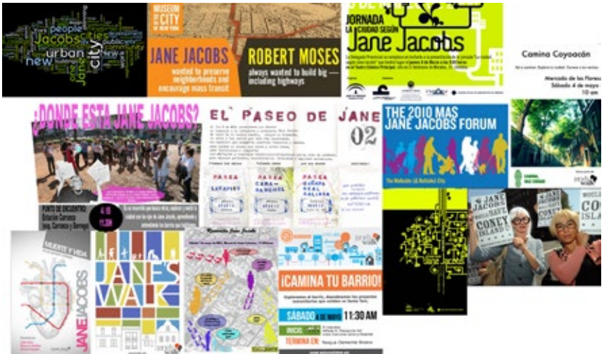
FIG. 1: IMÁGENES DE REVIVALISMO DE JANE JACOBS, TODAS ELLAS POSTERIORES A LA CRISIS DE 2008, Y LA PORTADA DE LA RECIENTE REEDICIÓN DE SU LIBRO “MUERTE Y VIDA DE LAS GRANDES CIUDADES” -AMERICANAS, INCLUIA EL ORIGINAL- QUE ALCANZÓ CASI INMEDIATAMENTE SU SEGUNDA EDICIÓN [1].

procesos extremos na constituição da cidade