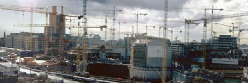
FIG. 6: POSTDAMER PLATZ, BERLÍN, ABRIL DE 1997. PAROXISMO OBLITERADOR.

de hecho anula la democracia, evacúa la dimensión política -p. ej. la promoción del desacuerdo a través de espacios materiales y simbólicos adecuadamente contruidos para el encuentro y el intercambio de la discrepancia pública – y finalmente pervierte y socava los propios cimientos de la polis democrática. Este régimen expone lo que Rancière llama el escándalo de la democracia: mientras promete igualdad, produce una forma de gobierno oligárquicamente constituida en la que el poder político se fusiona