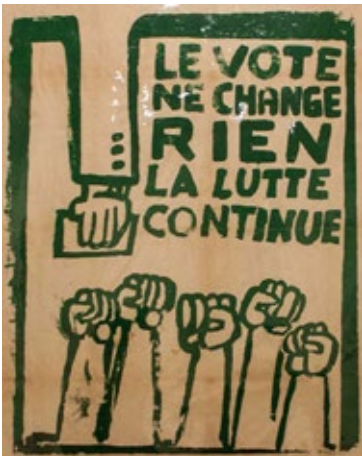
FIG. 5: ARRIBA, CARTELERÍA DE MAYO DEL 68 FRANCÉS. ABAJO, PINTADA CALLEJERA ACTUAL. SITUADAS EN ÁMBITOS POTENCIALMENTE RECIDIVANTES (VER FIG. 1), AMBAS COMPARTEN UN DESCREIMIENTO DE LA DEMOCRACIA, AUNQUE POR MOTIVOS ACORDES A SUS DISTINTAS ÉPOCAS. SI LAS PRIMERAS ALUDEN A LA MANIPULACIÓN POR PARTE DE UN ESTADO PATERNALISTA, LA SEGUNDA SE REFIERE MÁS A UNA OCULTACIÓN ESPECTACULAR Y FESTIVA, PERO TAMBIÉN TAIMADA, POR PARTE DE LAS EMPRESAS MULTINACIONALES, INCLUSO LAS APARENTEMENTE MÁS INOCENTES. SUS RESULTADOS NO SON MENOS DAÑINOS POR MENOS EVIDENTES. (IMAGEN 1: FLICKR: °WYZ° - CC-BY-NC-SA 2.0, RECORTADA. IMAGEN 2: WIKIMEDIA COMMONS. IMAGEN 3: DEL AUTOR