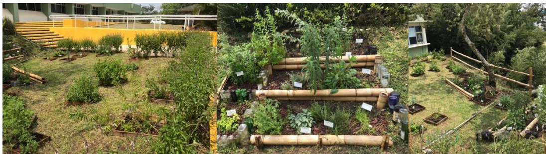
Figura 1 - Vista del jardín “Farmacia viva” del ITSX.

Basando en la metodología propuesta del Aprendizaje Basado en Proyectos (Díaz; 2006, Franco; Trejo; Roman, 2016; Salido, 2020; Villanueva; Ortega; Diaz, 2022), se propusieron diversos proyectos a estudiantes de tres ingenierías para la realización de sus residencias profesionales utilizando algunas plantas medicinales del jardín “Farmacia viva” (Figura 1).