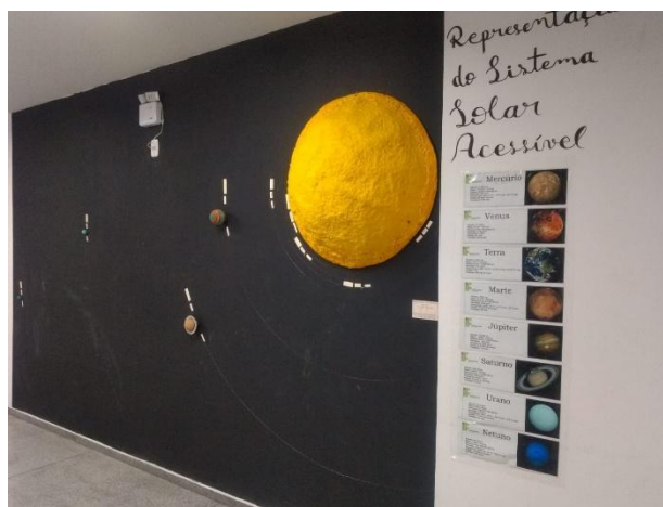
Figura 2 – Reconstrução do aparato experimental inclusivo para o ensino de Astronomia.

Todo o processo de modificação do aparato, considerado potencialmente significativo, é compatível com as etapas compreensão, transformação, reflexão e nova compreensão no sentido de Shulman (1987) e que contribuiriam no desenvolvimento do PCK dos envolvidos. Nesse caso, o PCK é uma mescla de conhecimentos de Astronomia, conhecimentos de educação inclusiva e Aprendizagem Significativa. O resultado encontra-se na Figura 2.