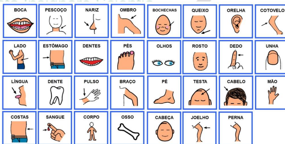
Figura 2 – Cartões do Picture Exchange Communication System considerados.