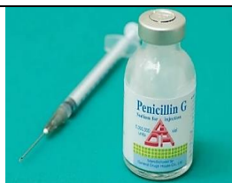
Figura 16 - Penicilina.