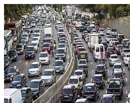
Figura 15 - Superpopulação e consequências.