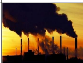
Figura 18 - Atividade industrial.