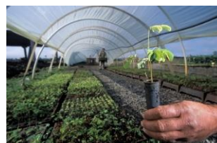
Figura 20 – Agricultura.