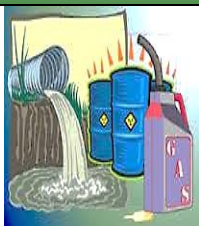
Figura 13 - Despejos químicos.