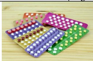
Figura 19 – Anticoncepcionais (pílula).