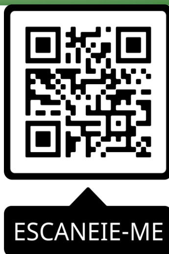
Figura 5 - QR code com o miniconto produzido pelos alunos

Fonte: VALE, Ricardo. Miniconto- Aluno Otávio- 7 B- Colégio Unifemm 2020.