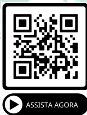
Figura 2- QR code 2 com a montagem do experimento de cultura de fungos em pães

Aponte a câmera seu celular para a figura 2 e assista de modo interativo o vídeo produzido pelos alunos, acerca da montagem do experimento de cultura de fungos em pães.