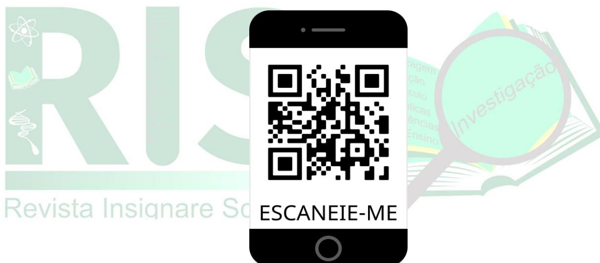
Figura 6 - QR code com o miniconto produzido pelos alunos

Fonte: VALE, Ricardo. Miniconto- Aluno Otávio- 7 B- Colégio Unifemm 2020.