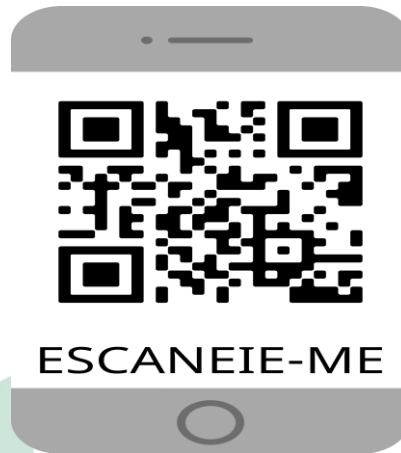
Figura 3 - QR code com o miniconto produzido pelos alunos

Aponte a câmera do seu celular para as figuras 3 e 4 e assista de modo interativo o vídeo produzido pelos alunos, relatando seus apontamentos e fotografias em forma de um miniconto.