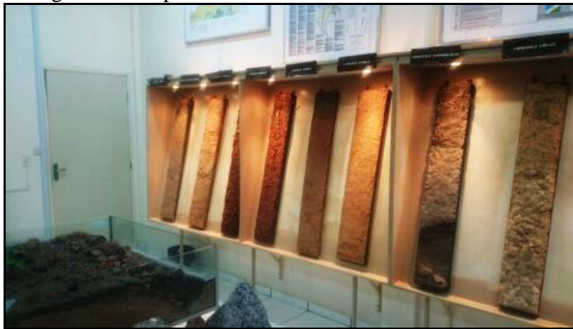
Figura 02 – Tipos de solo: Museu de Solos em Roraima