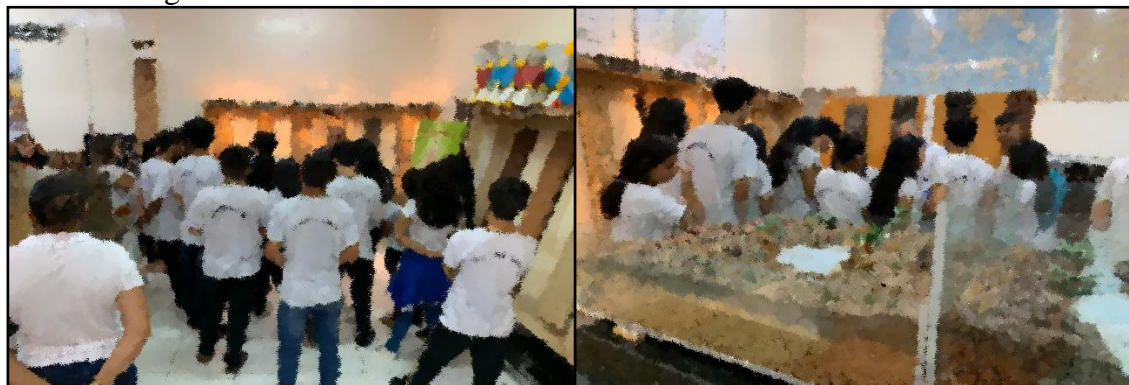
Figura 04 – Visita técnica de alunos: Museu de solos em Roraima