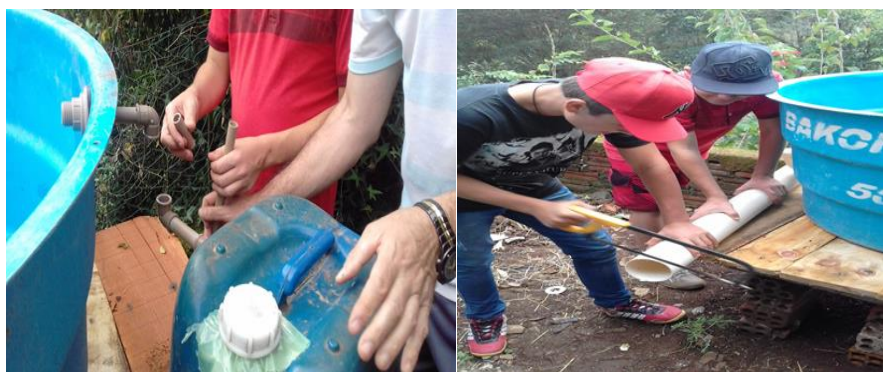
Figura 1 – Construção do Biodigestor pelos estudantes, na Escola.

A Figura 1 ilustra o trabalho dos estudantes na construção do biodigestor.