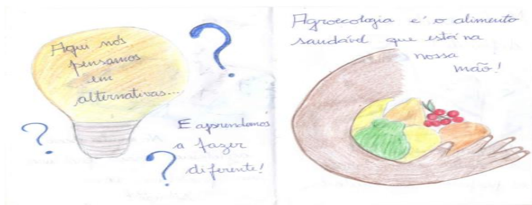
Figura 2 – Cartaz elaborado por um grupo de estudantes.

A Figura 2 apresenta o cartaz produzido por um grupo de estudantes.