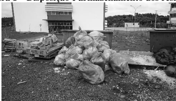
Figura 1 – Disposição e armazenamento dos resíduos.

As Figuras 1 e 2 apresentam a forma como, atualmente, os resíduos são dispostos e armazenados na instituição, até a empresa responsável fazer o recolhimento, transporte e concluir a destinação.