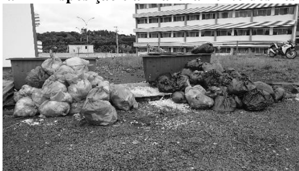
Figura 2 – Disposição e armazenamento dos resíduos.