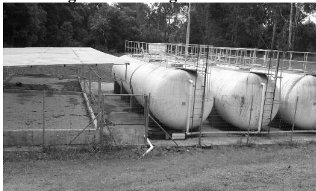
Figura 3 – Vista geral da E.T.E

nenhuma desconformidade. O lodo de esgoto é depositado em leitos de secagem e enviado para aterro sanitário, através de empresas devidamente legalizadas para a execução destes serviços. Haverá no ano de 2016 um processo licitatório para que uma empresa se torne responsável pela manutenção da E.T.E.