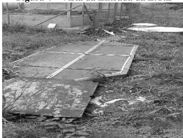
Figura 4 – Vista da Entrada da E.T.E