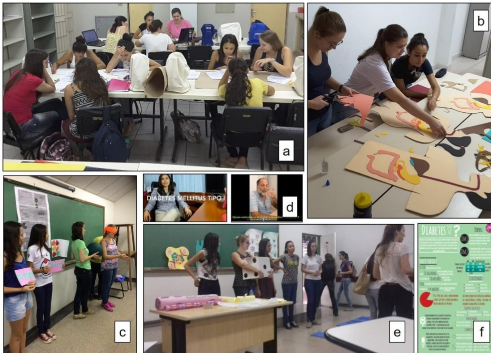
Figura 1. Equipe empenhada na idealização, planejamento e construção das atividades do projeto. Em a . Estudo sobre os aspectos celulares da diabetes e da obesidade, b . Produção de modelos em EVA (Ethylene Vinyl Acetate), c . planejamento da dinâmica, d . coleta de depoimentos de diabéticos, e . planejamento do jogo, f . infográfico finalizado sobre o diabetes.

as complicações, por meio de gráficos, esquemas e ilustrações formatados num infográfico construído pela equipe e exposto em forma de banner . Essa etapa foi uma apresentação expositiva e de rara interação com os alunos.