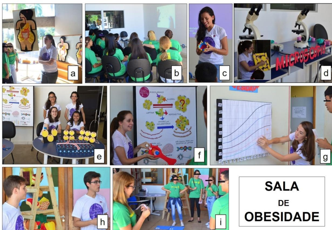
Figura 4. Etapas 1 (a) 2 (b), 3 (c), 4 (d), 5 (e), 6 (f) e 7 (g-h) da sala temática sobre a obesidade.

Na Etapa 8, a prevenção da obesidade mediada pela alimentação foi trabalhada utilizando-se uma pirâmide gigante para exemplificar a ideia de um prato saudável e também foi ressaltada a importância da atividade física, utilizando-se a comparação entre o alimento ingerido e o exercício necessário para gastar as calorias ingeridas. Nessa última atividade, os alunos foram respondendo sobre o esporte e o alimento que achavam compatíveis.