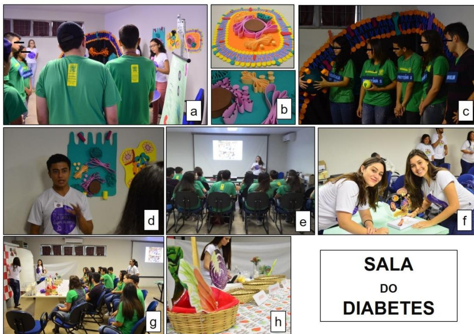
Figura 2. Etapas 1 (a) 2 (b), 3 (c), 4 (d), 5 (e), 6 (f) e 7 (g e h) da sala temática sobre o diabetes.