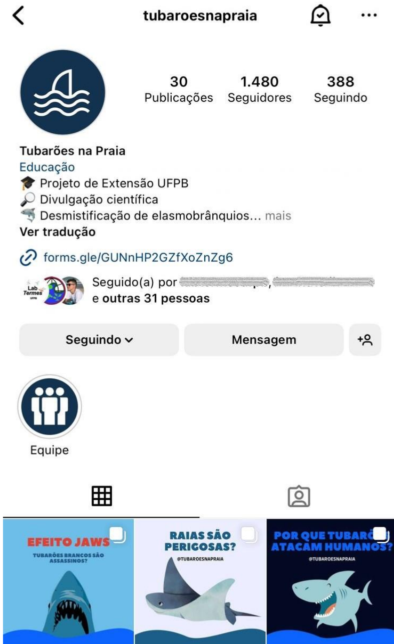
Figura 1. Página inicial do perfil @tubaroesnapraia no Instagram .

Foram realizadas postagens semanais relacionadas à biologia dos elasmobrânquios, sua anatomia, taxonomia e hábitos reprodutivos, além da exposição de espécies exclusivas da fauna paraibana. Também foram realizadas uma série de enquetes na função Stories de modo a levantar dados sobre o conhecimento e percepção dos seguidores da página na plataforma Instagram a respeito do grupo abordado. Além disso, durante visitas ao laboratório de Ictiologia da Universidade Federal da Paraíba, os participantes do projeto utilizaram o recurso caixa de mensagens do aplicativo, em que os seguidores podiam escolher as espécies de elasmobrânquios que gostariam de visualizar na página. Se as espécies requeridas estivessem presentes na coleção ictiológica, as mesmas eram expostas na plataforma, de forma a disponibilizar um tipo de acervo virtual dos espécimes armazenados na coleção de peixes, chamando a atenção do público.