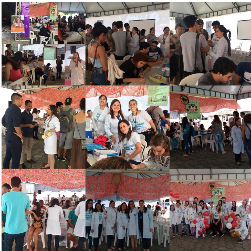
Figura 2. Registro fotográfico de algumas ações desenvolvidas no Projeto. Fotos autorizadas pelos participantes.

Na segunda etapa do Projeto, os estudantes elaboram um cronograma anual de atividades educativas em saúde, que são executadas em empresas, escolas, associações de moradores, Unidades de Saúde de Maceió-AL, assim como em cidades adjacentes. Entre os anos de 2016 e 2019 foram desenvolvidas 122 ações de educação em saúde, contemplando um total de 8.093 pessoas. Nas ações de educação em saúde, os membros do projeto lançaram mão de metodologias problematizadoras e dialógicas – fazeres em que se estabelecem relações de intercâmbio de conhecimentos, em rompimento com o modelo de verticalização entre os universitários e a sociedade. A partir das práticas educativas em saúde, os extensionistas consolidam o aprendizado e dialogam com a comunidade em um constante exercício de horizontalidade de saberes, alteridade e empatia, atributos essenciais para a formação em saúde. A Figura 2 apresenta alguns registros fotográficos de ações desenvolvidas pelo Projeto, e a Figura 3 apresenta exemplos de materiais educativos produzidos.