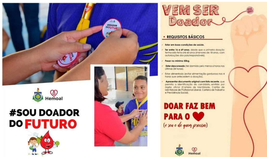
Figura 3. Exemplo de panfleto desenvolvido pelo Projeto. Fotos autorizadas pelos participantes.

Além das atividades de educação em saúde regularmente realizadas junto à comunidade, os integrantes do Projeto de Extensão organizam, anualmente, um evento acadêmico-científico com fim de expandir os conhecimentos sobre as temáticas abordadas para outros universitários não participantes da ação, bem como para acadêmicos e profissionais vinculados a outras Instituições de Ensino Superior do Estado. Na Tabela 1, elenca-se os eventos de cunho acadêmico-científico desenvolvidos no quadriênio (2016-2019).