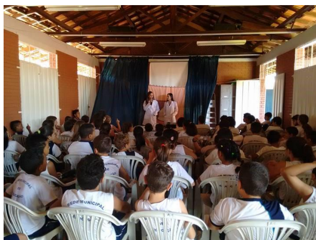
Figura 1. Aprendendo a linguagem científica através de novas palavras (tagarelar, acelerar, disparado, resistente, exercitar, pulsar e saltitar) e novos conceitos (adrenalina, artérias e veias, coronárias, infarto, entre outros).

Essas atividades são realizadas com a finalidade de contribuir para a consolidação da aprendizagem, como sugerido pela Espiral da Aprendizagem Criativa ( imaginar-criar-brincar-compartilhar-refletir-imaginar ), proposta por Mitchel Resnick (RESNICK, 2017) e adaptada à metodologia LHCL (Figura 3), na qual utilizamos a reflexão como ponto de partida e a estrutura do DNA (dupla hélice em espiral entremeadas por pontes de hidrogênio) como inspiração.