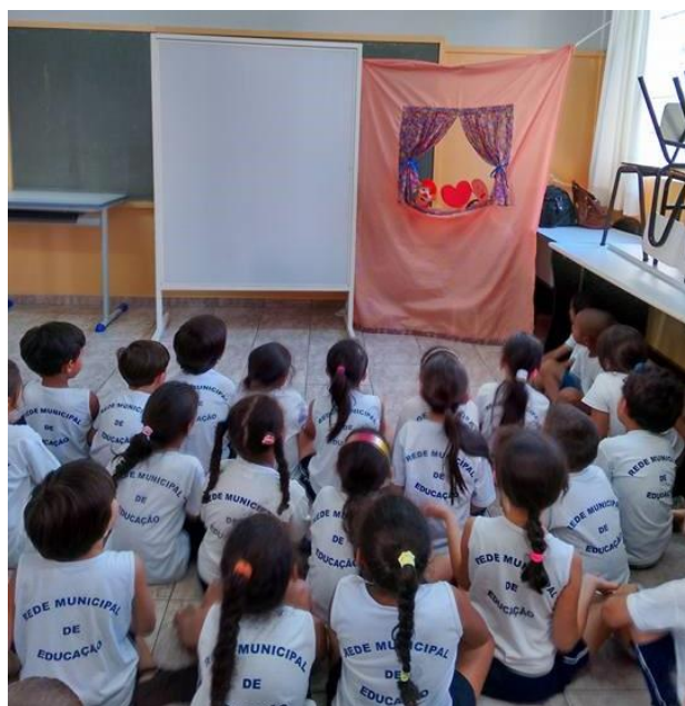
Figura 2. Apresentação da peça “Por que o Coração bate?”