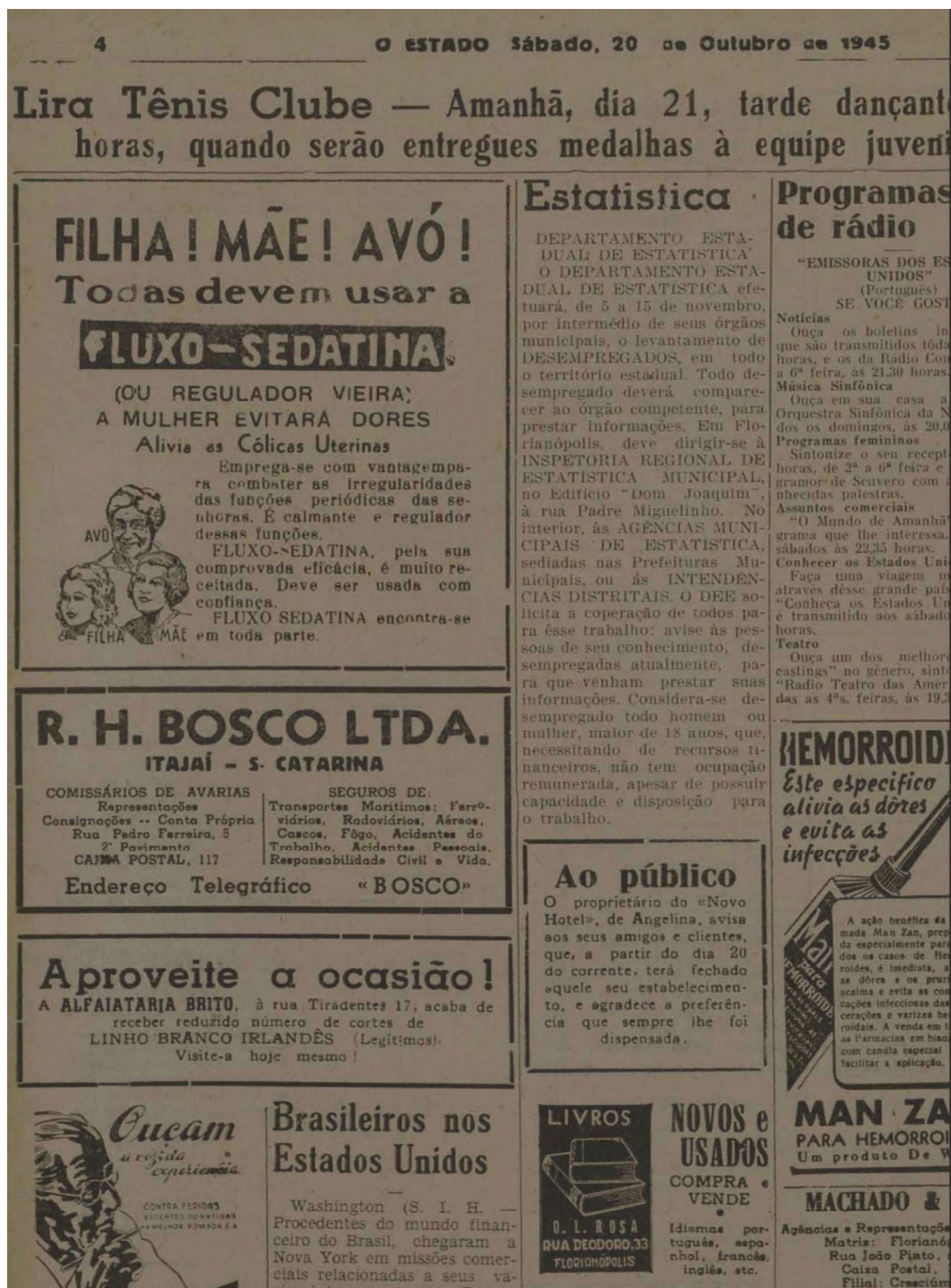
Figura 2: Publicidade no "O Estado" de 1945