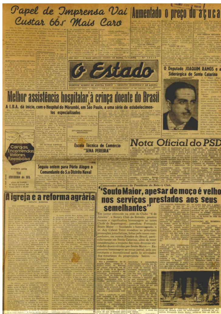
Figura 4: Fotografias no jornal "O Estado" em 1959

Em Florianópolis, esse processo destacado por Charles Monteiro pode ser observado, embora em uma escala reduzida. No jornal O Estado , as fotografias começaram a ganhar espaço em suas páginas a partir de 1950. No entanto, ao contrário do que se via nos grandes veículos midiáticos da época, especialmente nos jornais do Rio de Janeiro e de São Paulo, essas fotografias não eram abundantes. A maioria das edições continha de três a cinco fotografias impressas, principalmente nas capas, como pode ser visto em uma das edições de janeiro de 1959, conforme exemplificado a seguir 8 .