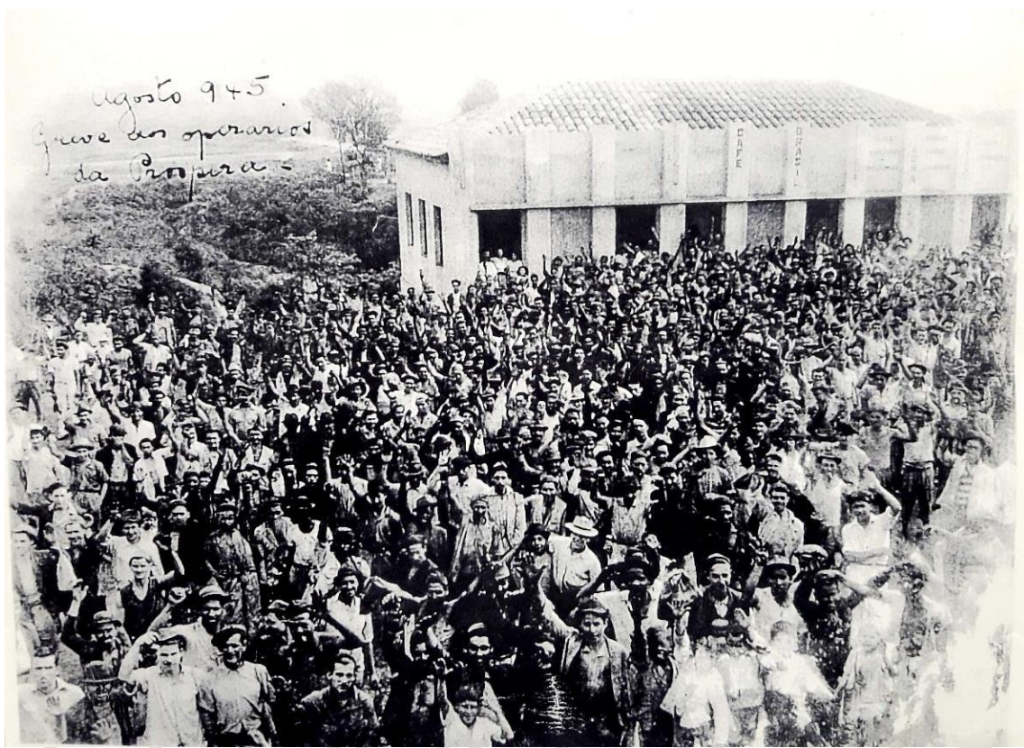
Figura 1: Greve dos mineiros da Carbonífera Próspera, Criciúma (SC), agosto de 1945. Bairro São Cristóvão