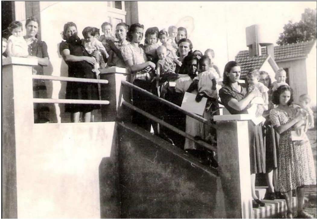
Figura 10: Mães e bebês no concurso de robustez infantil, 1944

Fonte: SILVA, Cristina Enes da. Nas profundezas da terra: um estudo sobre a região carbonífera do Rio Grande do Sul (1883/1945) . 2007. Tese (Doutorado em História) – Faculdade de Filosofia e Ciências Humanas, Pontifícia Universidade Católica do Rio Grande do Sul, Porto Alegre, 2007, p. 280.