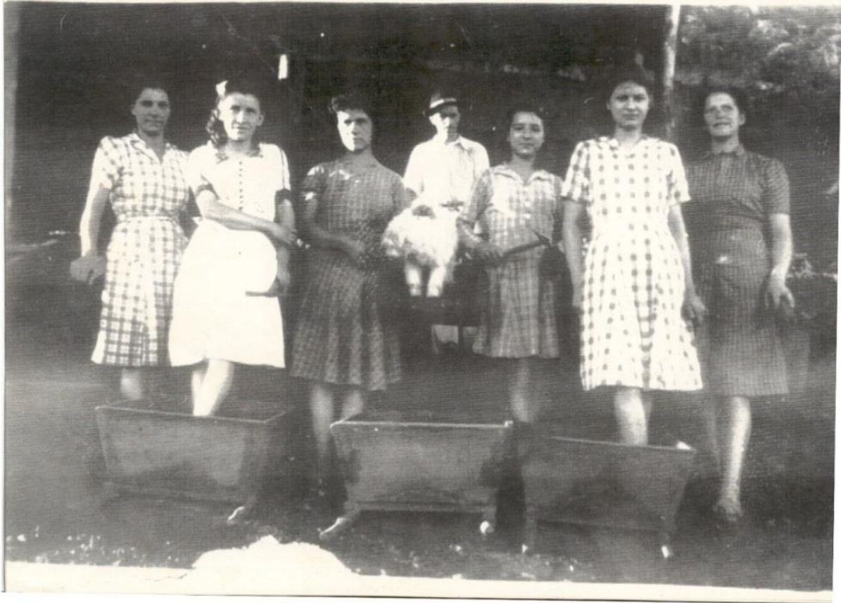
Figura 9: Mulheres “escolhedeiras” em uma mina de carvão de Criciúma na década de 1940. Foto sem local exato