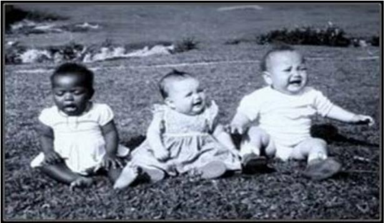
Figura 11: Concurso do bebê robusto, Criciúma (SC), década de 1950