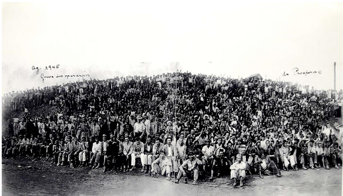
Figura 2: Greve dos mineiros da Carbonífera Próspera, Criciúma (SC), agosto de 1945. Bairro São Cristóvão