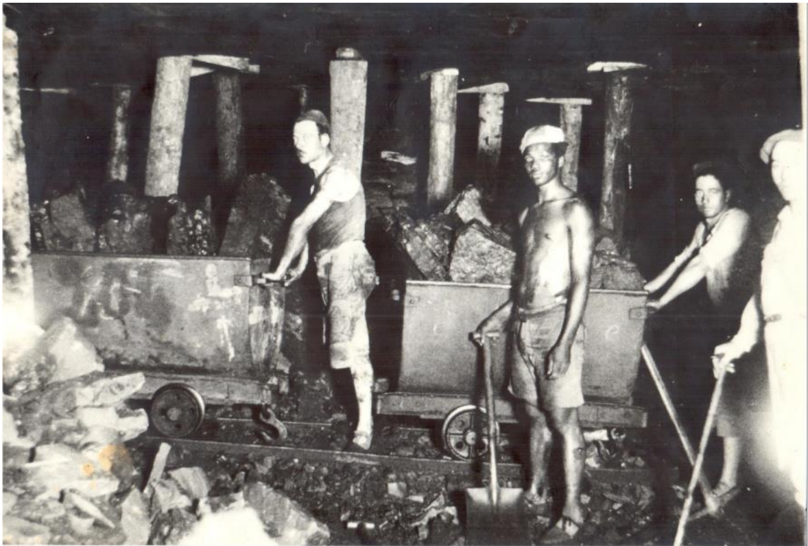
Figura 4: Mineiros no subsolo da mina de Arroio dos Ratos, município de São Jerônimo, Rio Grande do Sul