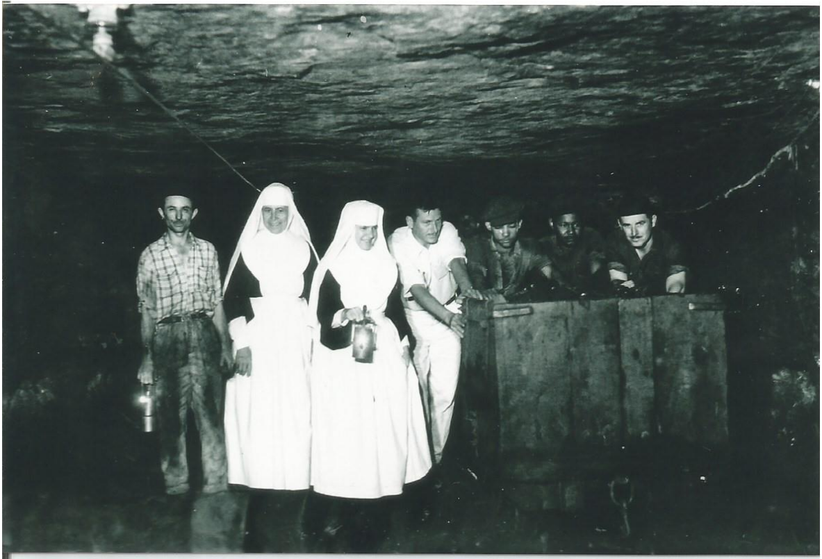
Figura 5: Visita das Freiras da Congregação das Irmãs da Divina Providência ao interior de uma mina em Criciúma, década de 1950

É importante salientar que entre as populações que viviam ao longo da costa litorânea da região sul catarinense, da pesca, também havia em grande número de afrodescendentes que migraram para trabalhar na mineração, o que foi constatado pela abundância de processos de acidentes de trabalho (de pesquisa anterior) em que aparecem trabalhadores negros nos autos (Mandelli, 2020, p. 62).