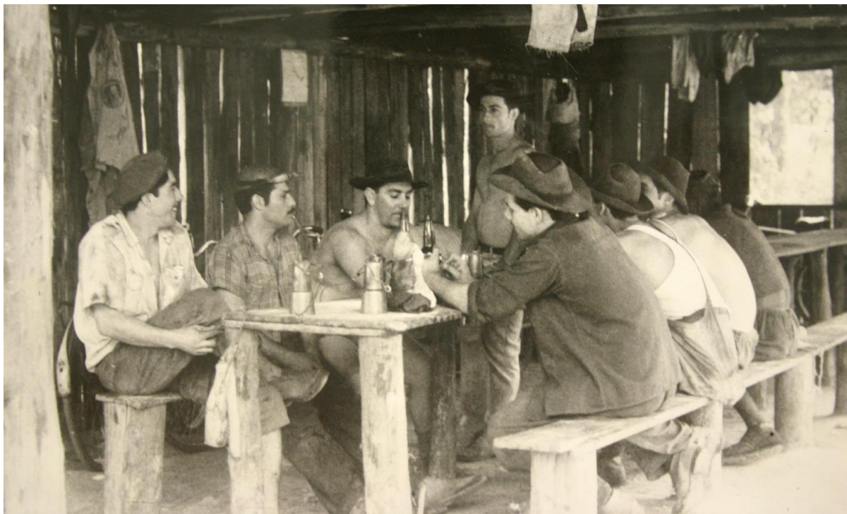
Figura 8: Mineiros reunidos antes do trabalho, Criciúma, década de 1950

É importante salientar, contudo, que todas essas dimensões do “ser mineiro”, que são múltiplas e se articulam não são identidades “naturais” do trabalhador, como que “herdadas biologicamente”; são características culturais, construídas historicamente nas relações de trabalho e fora delas: nas comunidades, no sindicato, nas bodegas, na imprensa, nas festas, no futebol, etc. Os espaços de socialização dos mineiros também são marcados por essa identidade social do grupo, quando se reúnem após o trabalho, para conversarem sobre os problemas do cotidiano laboral ou outros assuntos, quase sempre acompanhados de alguma bebida alcoólica. São momentos de reforço da noção de masculinidade, como pode-se observar na fotografia abaixo: