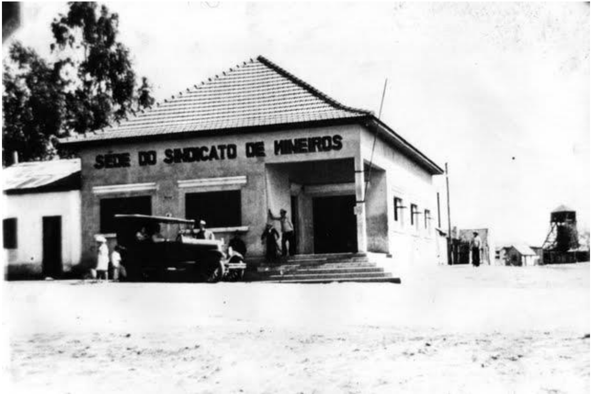
Figura 3: Sede do Sindicato dos Mineiros de São Jerônimo, década de 1940