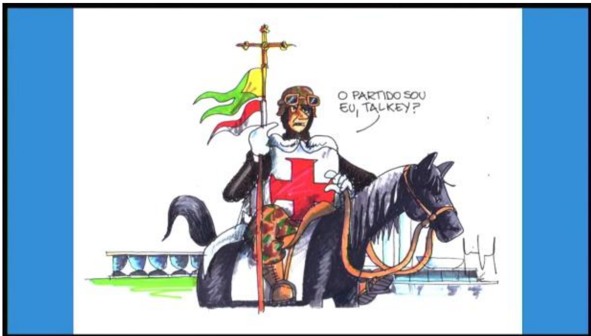
Imagem 2:

A imagem 2, é naturalmente uma extrapolação, mas se analisarmos boa parte do imaginário bolsonarista, vamos verificar fragmentos, ruínas dessas narrativas conservadoras inauguradas em nosso processo de Independência e que ainda mobilizam o imaginário coletivo. 3 A dimensão providencial e feudal vai aparecer o tempo todo nesse imaginário, que naturalmente na imagem acima é uma representação irônica, mas ironiza justamente um uso recorrente desses elementos por setores do bolsonarismo. Entendemos melhor então porque é tão importante que hoje chegue ao Brasil o coração de Dom Pedro I, porque a pergunta fundamental das nossas elites políticas no processo de Independência foi formulada pelo Abade DePradt no contexto das reflexões pós-Revolução do Haiti. De Pradt publica um panfleto com o título A quem pertencerá a América, à Europa ou à África? A questão programática que está na mente de boa parte dessa elite é que só há futuro possível, só há civilização possível, que passa atualização contínua de nossos vínculos com a Europa. Não deve nos surpreender que o atual governo tenha feito o esforço de trazer o coração de Dom Pedro: ele é uma relíquia em