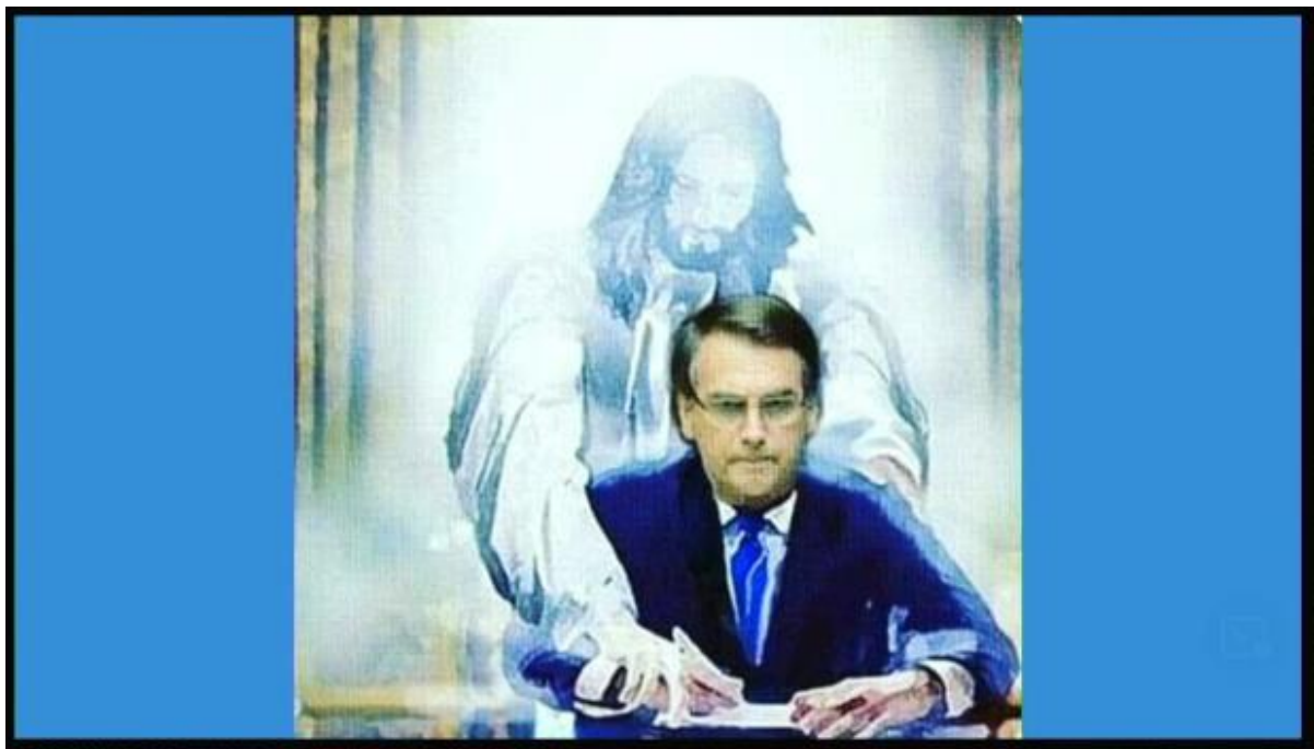
Imagem 3: Retirado da apresentação de Valdei Araújo no XIX Encontro Estadual de História – ANPUH/SC

A imagem acima não é um exemplo aleatório do imaginário bolsonarista. Há inúmeras variações dessa mesma imagem, da mão de Deus guiando a caneta bic de Bolsonaro. São narrativas históricas que se atualizam; não se atualizam mais de maneira ideologicamente coerente, até porque a base bolsonarista é fragmentada, a coerência não interessa ao bolsonarismo. Ela tem coerência com as suas origens, então nós podemos recuperar essas coerências mesmo que no nosso tecido social hoje não seja necessário a exibição dessa coerência. É um exemplo bastante ilustrativo do que temos chamado de atualização atualista, uma visada que extrai de um passado arruinado fragmentos que sirvam às fantasias do presente.