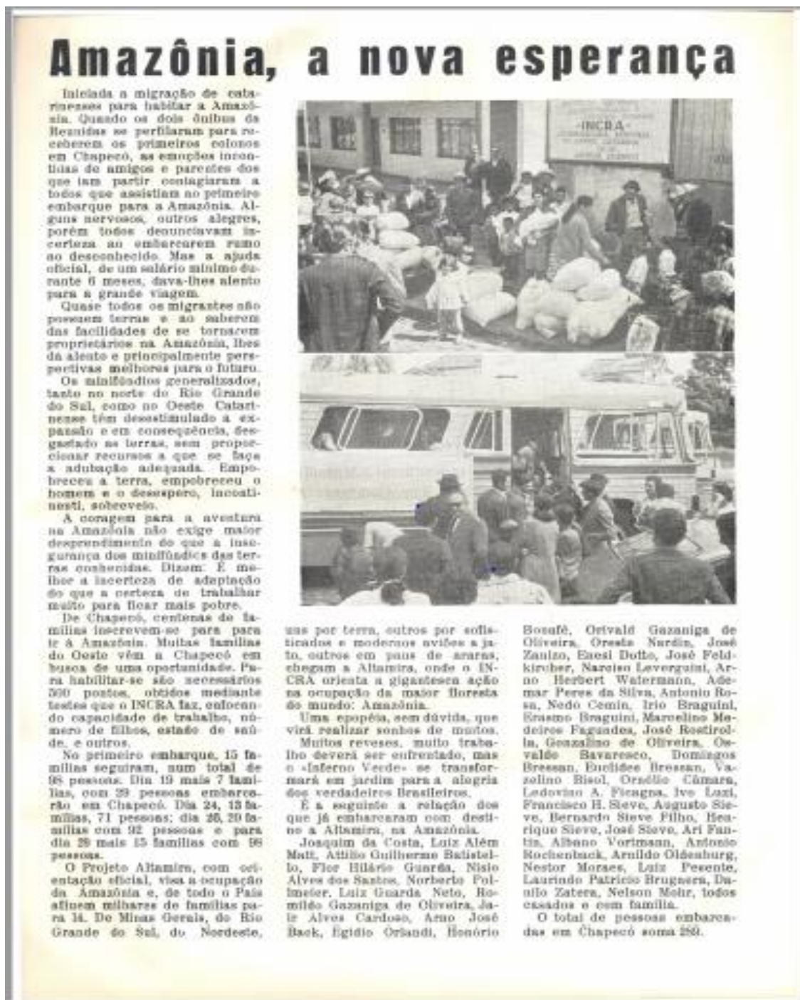
Figura 2: Amazônia, a nova esperança