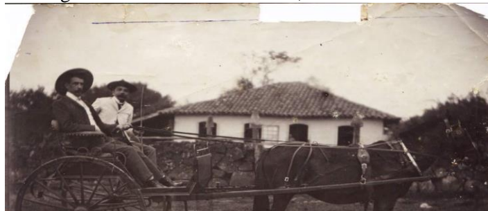
Fig. 4 - Fazenda Cruz de Malta, casa de Correia Pinto

Segundo a análise da estrutura demográfica, social e econômica da Vila de Lages entre 1798 e 1808, há um significativo aumento do número de agregados nas propriedades, o que pode ser explicado pela charqueadas, e também pela procura de carne bovina pelos habitantes do litoral da Província de Santa Catarina. Como consequência direta, as ricas propriedades do Planalto exploravam o trabalhador pobre, tornando a região uma mescla de elementos humanos de origem étnica variada: Em menor número o branco rico, que era proprietário de terras e o político local; ademais, escravos, negros forros, índios e brancos pobres que viviam em torno do seu senhor, que estabelecia uma relação paternalista onde um relacionamento supostamente familiar atenuava as diferenças sociais entre senhores e servos (EHLKE, 1973.p.76).