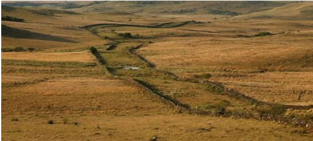
Fig. 2 - Taipas. No detalhe, corredores construídos nos campos da “coxilha rica” - Lages

Na diversidade de formas e encaixes das pedras cria-se uma unidade que se torna sólida, longa e imponente na paisagem.