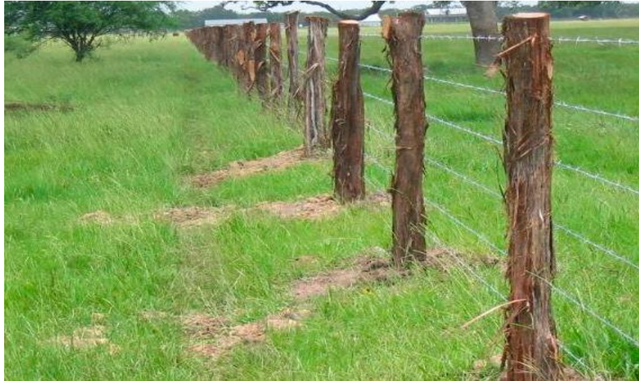
Fig. 5 . Cerca de Arame Farpado (Aramado). Lages.