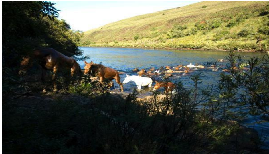
Fig. 3 - Passo de Santa Vitória, Coxilha Rica. Lages.

Aluisio de Almeida afirma que a abertura destas estradas e caminhos era tratada pelos paulistas com o termo “descortinar”, ou seja, cortar o mato e abrir passagem em qualquer lugar (ALMEIDA, 1945. p.25).