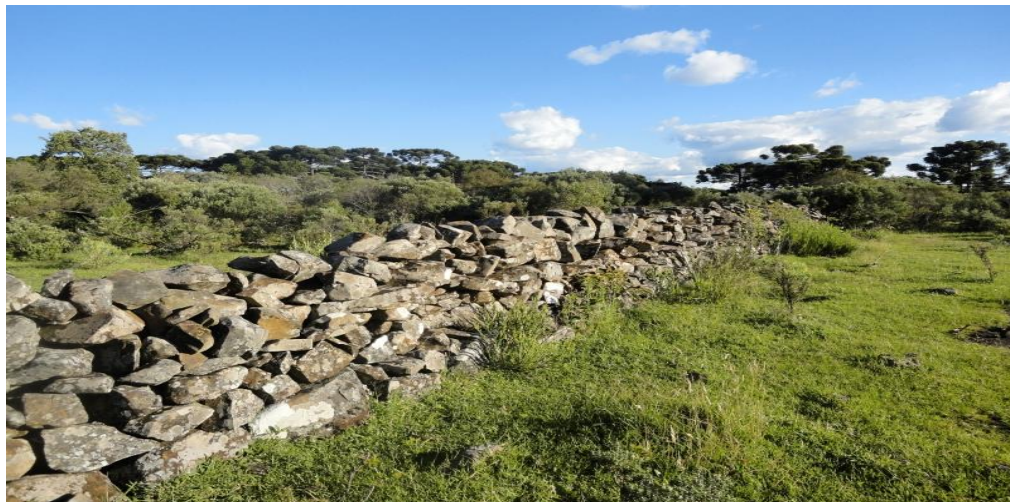
Fig. 1 - Taipas. No detalhe, corredores construídos nos campos da “Coxilha Rica”- Lages.

Este mesmo historiador, ao descrever as origens do homem da Guerra do Contestado, afirma que o caboclo é a representação nativa e miscigenada, que não possui identidade étnica, mas que se encontra em várias regiões do Brasil, pois rompeu obstáculos geográficos, povoando montes, vales e horizontes (op.cit.p.14). Especialmente na região do Planalto Serrano Catarinense seus hábitos culturais são diversificados, deixando traços de sua cultura na paisagem. No entanto, sua representação social foi negada no processo de ocupação do território. Indígenas e negros foram segregados na composição política, econômica, social e cultural do Planalto Serrano Catarinense, o que se explica em parte pela ideologia de branqueamento do século XX, que previa a elaboração de uma ideia de nação brasileira mais branca, desconsiderando as heterogeneidades, inferiorizando e marginalizando, sobretudo, ex-escravos. (ARRUDA, 1972.p. 56).